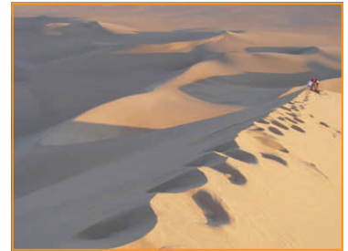
Abendstimmung aus 200m Höhe

Aufgrund der Fülle des Berichtes erscheint der nächste Teil in der Mai Zeitung. azi