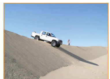
Kurze Steilabfahrten lockern die Strecke auf