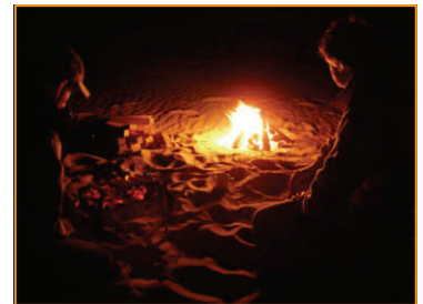
Lagerfeuer mit altem Verpackungsholz.