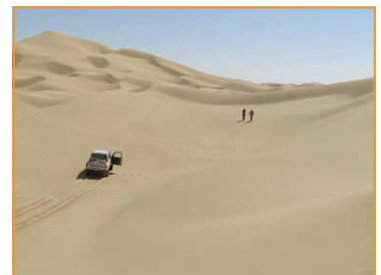
Die Dünen südlich von Ain Sidi Mohammed