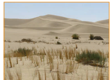
Ain Sidi Mohammed, offenes aber mückenverseuchtes Wasser gleich neben den Dünen