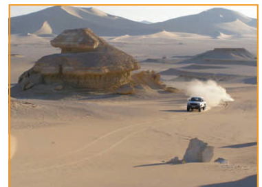
Südlich der Dünen von Ain Sidi Mohammed