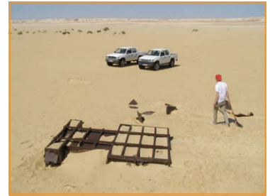
Das Wrack eines Ford F30 der G.1-Patrol LRDG welcher aufgrund von irreparablen Schäden aufgegeben wurde

Nach 50 Kilometern Richtung Süden auf der Teerstrasse biegen wir nach links auf eine tief-sandige Piste ab. Für weitere 45 Kilometer folgen wir der Piste immer geradeaus Richtung Ost-Südost, dann drehen wir wieder auf Süden ein. Wir hätten auch noch weiter auf der Teerstrasse fahren können. Aber einerseits wollten wir ja nicht Teer bolzen sondern die