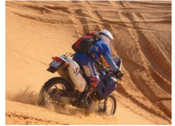
Pawel Studer in den Dünen

ausgeruht ging es am nächsten Morgen in die Riesendünen nach Tiaret. (Fortsetzung folgt) az