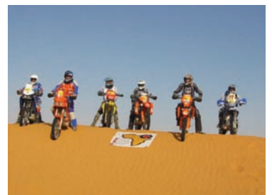
Fotosession in den Dünen bei Ksar Ghilane