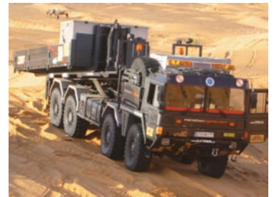
Der 8x8 MAN SX beim Abladen