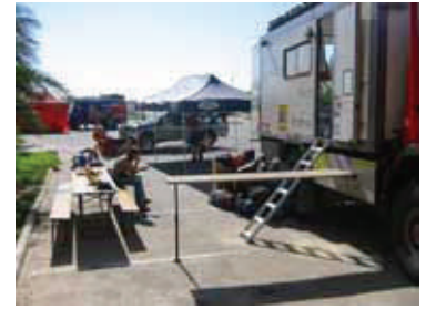
Serviceplatz in Douz

direkt vorn über und schon war es eine Talfahrt, wie auf einer Achterbahn. Ein Erlebnis kann ich nur sagen. Am 2. Tag abends in Ksar Ghilane veranstaltete das Team der ERG ORIENTAL ihre Jubiläumsfeier mit Freibier und Feuerwerk. Die Stimmung war gut. Das Fest ging lange, obwohl die Fahrer am nächsten Morgen früh raus mussten.