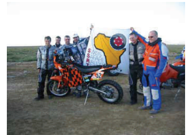
Vor dem Start - Alle noch heile!