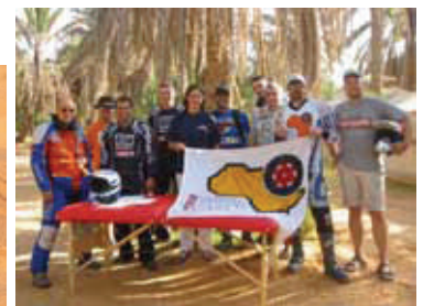
Ein Team in guten Händen