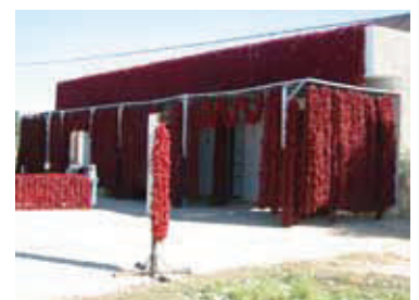
Paprika als Hausverzierung