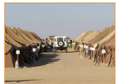
Das "Eclipse Camp" südlich von Gialo

Er fährt in der richtigen Geschwindigkeit über die Krete. Bergab nicht bremsen – das macht der Motor schon ausreichend genug. Dann ist er unten. Er hält an und steigt ..