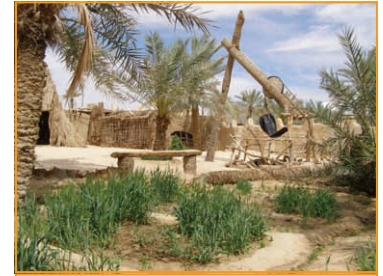
Augila, der wiederaufgebaute Teil der alten

Da ich auch noch etwas vom Sand haben möchte, haben wir die Sitzplätze vertauscht. Und wir haben Glück. Die grossen Haufen kommen auf dieser Seite direkt bis an die Sandebene heran. Keine dieser lästigen Vordünen. Und da ist sie auch schon – eine riesengrosse Dünenflanke, die aus dem Flachen aufsteigt und langsam immer steiler wird... jaaaaaaaa. Als ich so etwas das letzte Mal gesehen habe, war ich mit dem Passat unterwegs und danach fast zwei Stunden am schaufeln. Jetzt will ich es gleich richtig wissen und hole noch in der Ebene Anlauf. Dritter Gang, Vollgas. Hinein in die Flanke. Es wird steiler; ganz schnell runterschalten in den zweiten. Der Motor heult. Und dann geht es hinauf. Etwa in fünfundvierzig Grad zur Falllinie. Immer höher, noch höher, etwas höher muss es noch gehen, die Touren brechen ein, die Geschwindigkeit geht zurück und dafür die Herzschlagsfrequenz hinauf. Ich schlage ein, denn ich muss den Wagen noch in die Abwärtsrichtung bringen bevor ich festhänge. Wenn mir das aus der Aufwärtsbewegung passiert, dann komme ich nur rückwärts wieder weg – und das will ich hier auf keinen Fall. Wenn ich die Motorhaube noch nicht nach unten gerichtet habe und im rechten Winkel zur Falllinie festsitze, dann ist das noch viel blöder. Aber noch fahre ich. Noch komme ich voran. Und dann ist es überwunden.