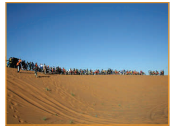
Das legendäre Dünenrennen an die 120 Mopeds starten à la Le Mans, dann mit Vollgas durch die Dünen.

Landschaftlich fahren wir noch durch die Schlucht ohne Namen, einen tiefen Einschnitt in die Felsen, die mal glatt, mal scharf und mal nass sind. Einige Male wirft mich die EXC ab, oder war es umgekehrt?