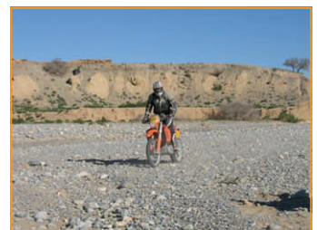
Ausgetrocknete Flussbetten mit allen Sorten verschiedener Steine, den Geologen würde einer abgehen...