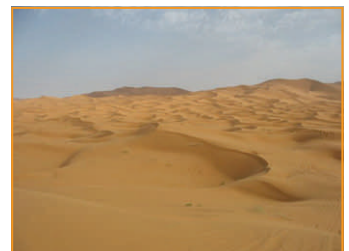
Der grösste Sandkasten für Männer, der Erg Chebi.