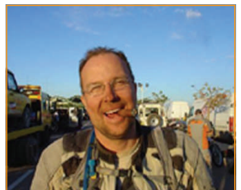
Siegerzigarre, Robaina, nur das Feinste.