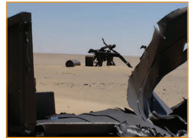
Ein gesprengter Ford F60 der "Heavy Section" der LRDG

Aufgrund der Fülle des Berichtes erscheint der nächste Teil in der Juni Zeitung. azi