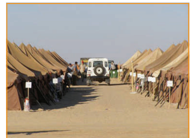
Das "Eclipse Camp" südlich von Gialo