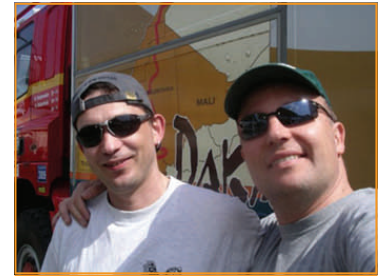
Mit breitem Grinsen haben wir uns gestern mal wieder...