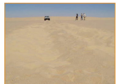
Das "verlorene Auto