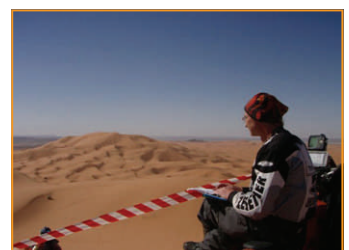
Ommm... da komm ich gleich gut durch, Ommm...