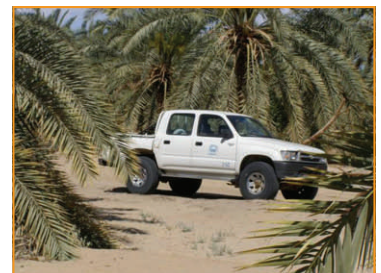
Die Palmgärten von Augila