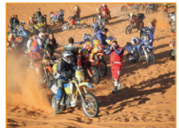
Dann lieber durch die Steppe, das macht Laune.