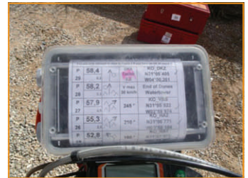
Dann ist es schon Zeit, noch 15, 10, 5 und Gas.