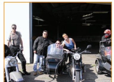
An einem Sonntag Götti sein...