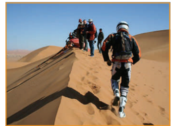
...die DK, die auf einem 100 Meter hohen Dünenkamm ist...