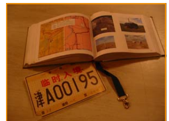
Erich Käser's Reisehandbuch