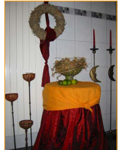
Weihnachtsessen 2008, es gibt zwar keinen Fisch, aber trotzdem ein ganz feines Abendessen in gemütlicher Atmosphäre.