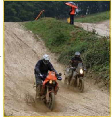
KTM Adventure Club Tell Trophy -it's rain again

Das Unheil begann schon in der Nacht zum Samstag. Wir hörten die Regentropfen auf das Dach der Halle hinunter prasseln. Wenigstens war es in der Halle trocken. Nach einem ausgiebigen Frühstück ging es los für die Teilnehmer. Irgendwie war ich froh, dass ich heute nicht fahren musste. Aber andererseits macht mir ja nur zusehen auch kein Spass. Die Teilnehmer fuhren mit fünf Minuten Abstand los und folgten einem markierten Weg zur Trainingspiste von Roggenburg. Neue Piste alter Modus, die Teams konnten oder mussten eine Stunde lang auf der Piste Runden drehen. Jede Rund zählte zur Gesamtwertung. Die Piste war eng, rutschig und sehr nass. Dies führte vereinzelt zu Stürzen und zu Staus an den Anstiegen. Nach dem morgendlichen Frühsport wurden die Teilnehmer mit dem Roadbuch durch den schönen Schweizerjura geführt. Schön natürlich in Anführungs- und Schlusszeichen, denn es regnete am Samstag nur einmal. Als alle Fahrer unterwegs waren ging ich mit der Orga zurück nach Ederswiler wo noch die letzte Sonderprüfung ausgesteckt werden musste. Es wurden zwei verschiedene Runden auf der Piste ausgesteckt. Es sollte eine einfachere und eine schwierigere Runde geben. Doch nach einigen Testfahrten von Orgamitgliedern wurde die vermeintlich schwierigere und längere Runde