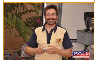
Wir sehen uns am nächsten Höck!