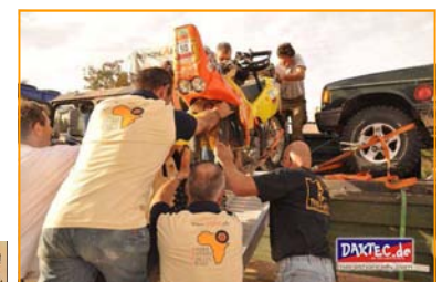
Zu dritt geht das Verladen doch