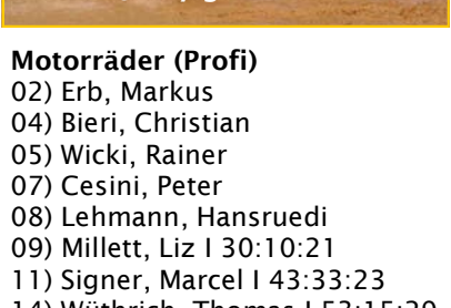
Jessy gibt alles