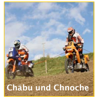
Chäbu und Chnoche